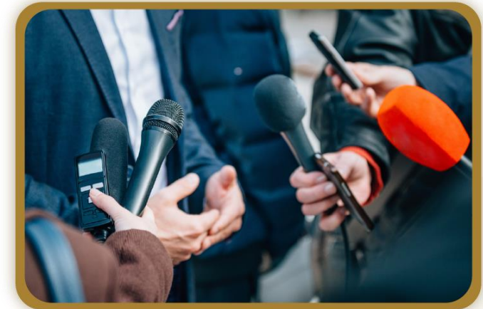
Figura 6. Ejemplos del uso del pretérito indefinido.