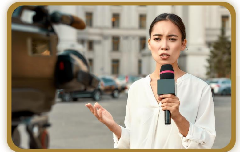
Figura 9. Ejemplos del uso del pretérito perfecto.